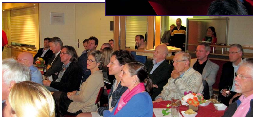
Aandachtig publiek luistert (en kijkt) naar de interviews

De live interviews waren te beluisteren in het radioprogramma Punt Komma van RTV Oost. Het was voor zowel gasten als bezoekers een boeiende bijeenkomst.