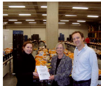
Overhandiging cheque aan de Voedselbank Enschede

Op vrijdag 4 november jl. vierde Echelon zijn vijfde lustrum. Tijdens een drukbezochte receptie in de kantine van BTC-Twente werd teruggeblikt, maar ook vooruit gekeken. Voor de ontvangen giften waren drie goede doelen geselecteerd: Handycamp Overijssel, Voedselbank Enschede en Welkomhuis Twente.